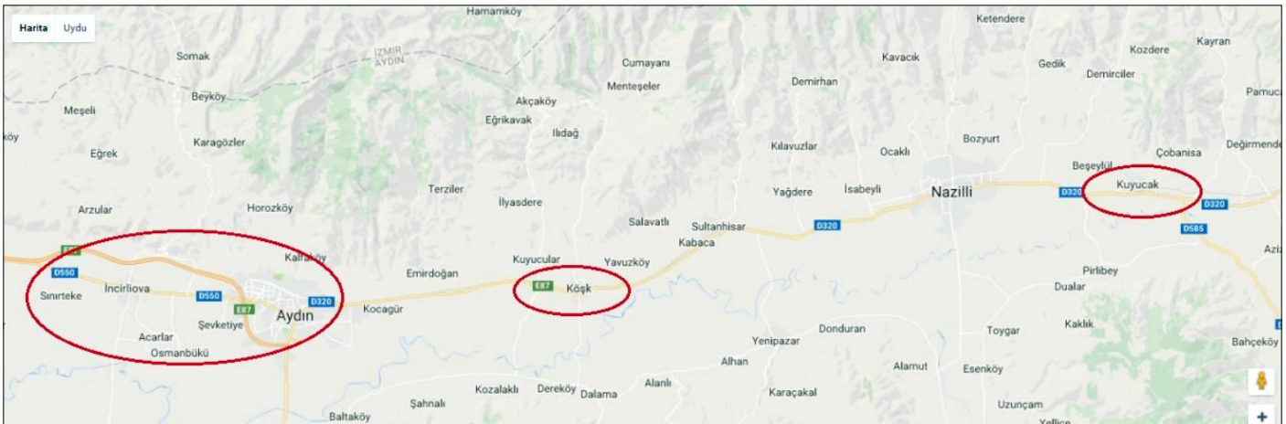
Şekil 1. Çalışma alanlarının coğrafi konumu.

Çalışma bölgeleri arasında en yüksek seropozitiflik %29.5 ile Aydın, Merkez'de saptandı ve bu oranla diğer bölgelerde saptanan oranlar arasında istatistiksel olarak anlamlı bir fark vardı ( p=0.006 ). Seropozitifliği etkileyen faktörleri bulmak amacıyla yapılan CHAID analizinde de IgG pozitifliği üzerine en etkili değişken, bölge olarak bulundu. Bölge iki gruba ayrılarak incelendi. Birinci grup olan İncirliova, Sınırteke Köyü ve Kuyucak, Pamukören Beldesi'nde seropozitiflik %10.1 iken; ikinci grup olan Köşk, Çiftlik Köyü ve Aydın, Merkez'de seropozitiflik %26.4 olarak saptandı ( p=0.004 ). Köşk, Çiftlik Köyü ve Aydın, Merkez bölgelerinde hayvan beslemeyenlerde se-