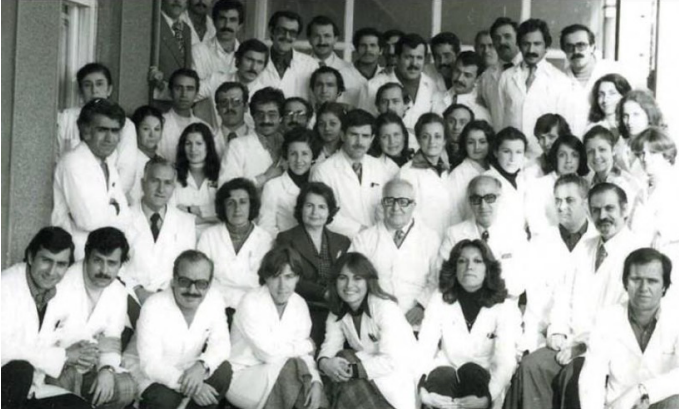
Resim 3. 40. Hizmet Yılında Çalışma Arkadaşlarıyla (1978) (21).