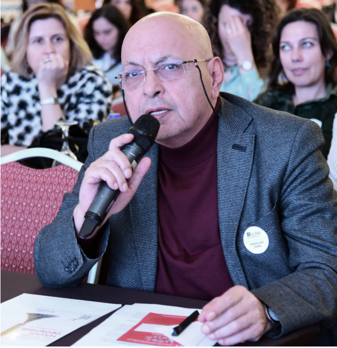
Resim 9. Klimik 2019 sırasında yapılan 17. Olağan Genel Kurul Toplantısı'nda.