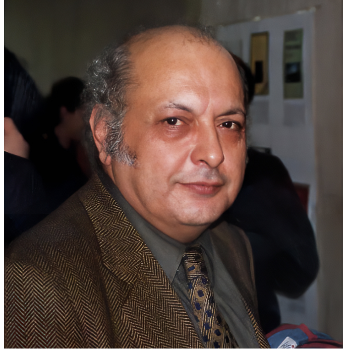
Resim 7. VII. Tıpta Uzmanlık Eğitimi Kurultayı (1-2 Aralık 2001, İstanbul)'nda.